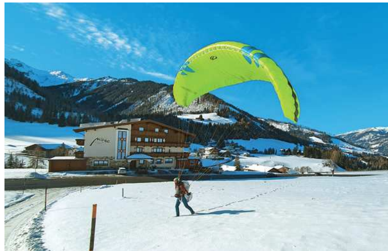
Landung am Monte mit Ultralite

noch Grödel anlegen. Spätestens beim Aufstieg durch die Steilflanken in der zweiten Hälfte der Tour verbessern sie spürbar die Trittsicherheit. Devise: unnötige Risiken vermeiden. Die Wetterbedingungen für den heutigen Tag sind nahezu perfekt.