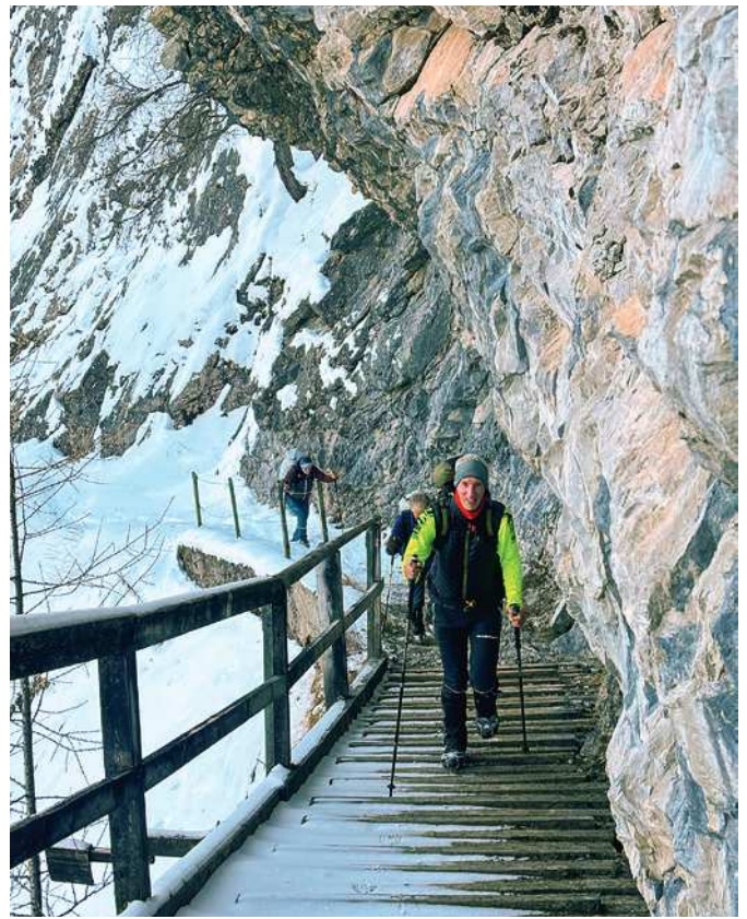
Der Weg durch den Fels