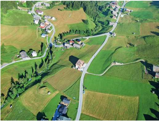
Monte mit Landewiesen