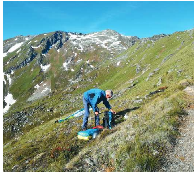
Startplatz im Sommer

Landeplatz: Landemöglichkeiten auf den Wiesen gegenüber dem Aparthotel Monte entlang der B 111 vor Ortseingang Kartitsch