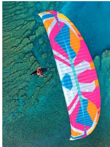
auf Reunion

Unser Titelpapier ist komplett recycelbar