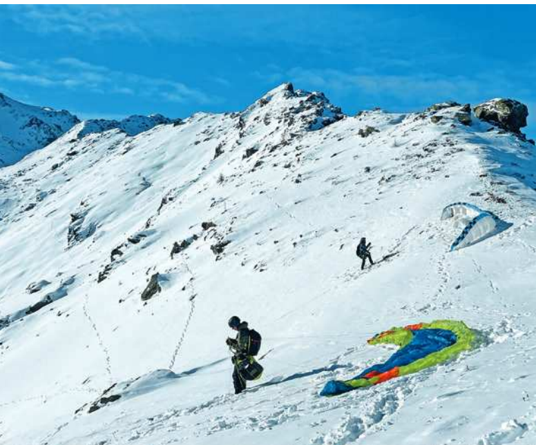
Startvorbereitung im Winter