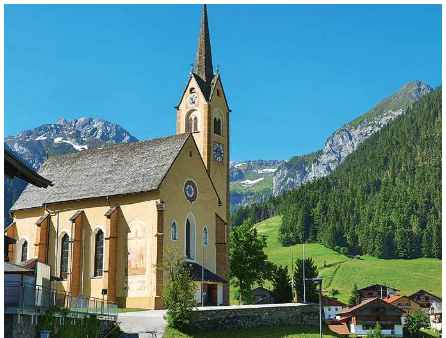
Kirche Kartitsch mit Gatterspitze rechts

Die geteerte Straße geht am Sportzentrum von Kartitsch in einen geschotterten Forstweg über. An der Waldgrenze heißt es im Winter