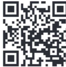
Film zu Gatterspitze