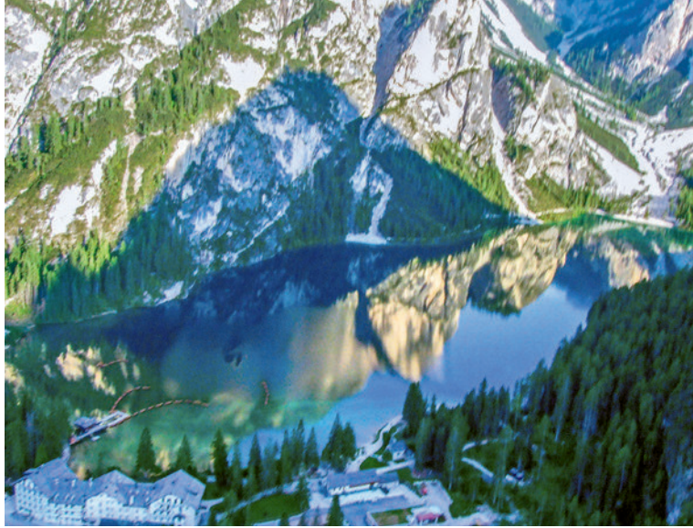
Flug über den Pragser Wildsee