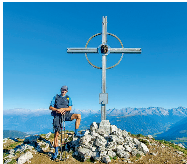
Norbert am Gipfelkreuz