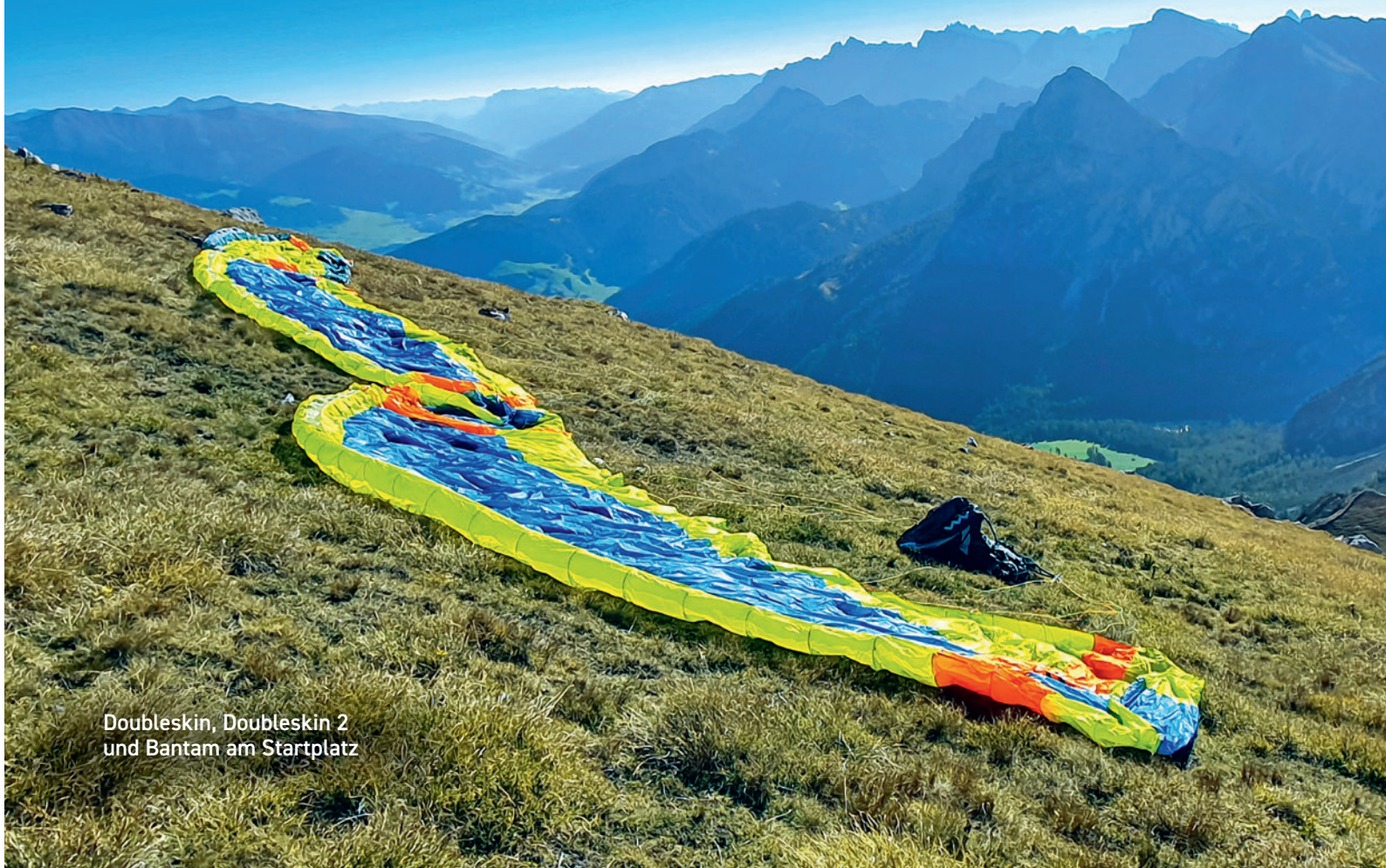
Doubleskin, Doubleskin 2 und Bantam am Startplatz