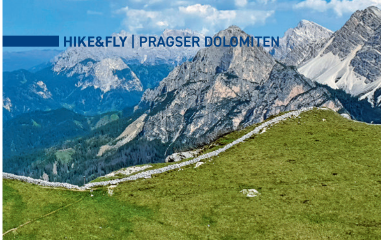
Blick zurück zur Pragser Furkel