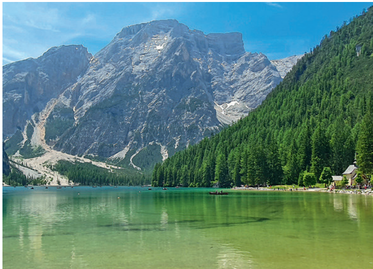
Pragser Wildsee mit Seekofel

Sobald wir die Steinmauer erblicken, ist der sehr steile und schweißtreibende Aufstieg geschafft. Am Sattel angekommen, haben wir den schwierigsten Teil bereits gemeistert.