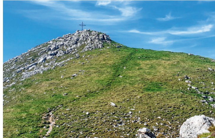
Das letzte Wegstück zum Gipfelkreuz

Zu unseren Füßen schimmert alsbald der Prager Wildsee, während uns zunehmend auch die bleichen Dolomitenberge in ihren Bann ziehen.